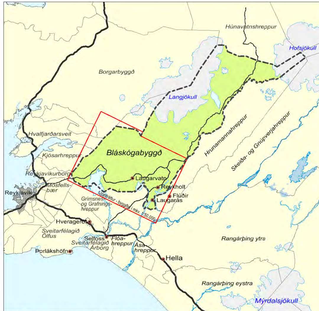
Yfirlitsmynd af Bláskógabyggð í mkv. 1:1.000.000.