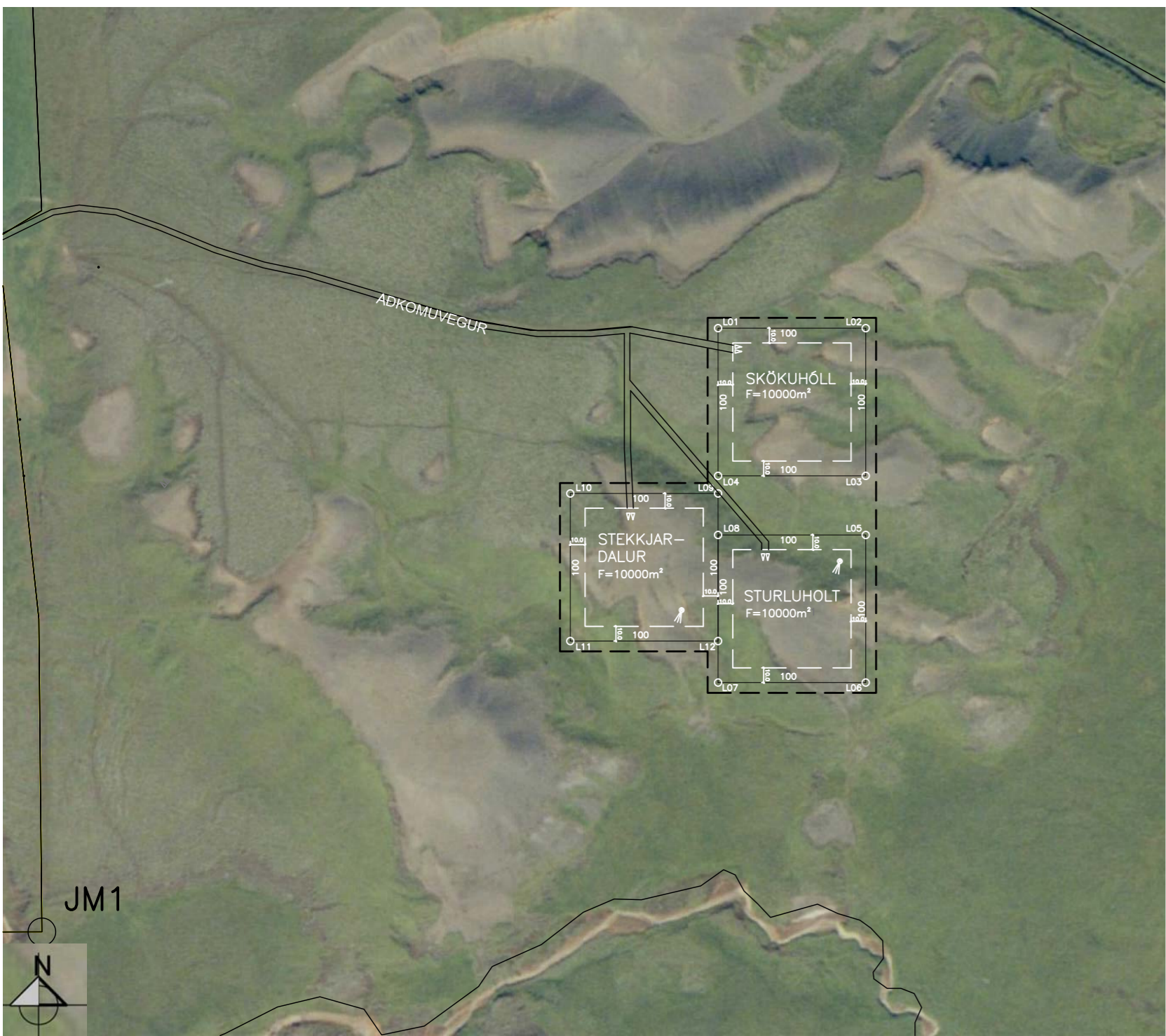
NÚVERANDI DEILISKIPULAG M 1 : 5000

samþykkt í sveitarstjórn Grímsness og Grafningshrepps 3.7.2008