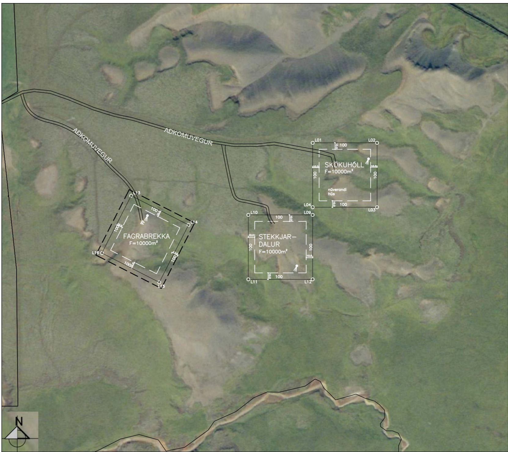
DEILISKIPULAGSBREYTING M 1 : 5000

Á hverjum byggingareit er heimilt að byggja allt að 150m 2 sumarhús og 30m 2 geymslu á hverjum byggingareit. Mænishæð húsa má vera allt að 5.5m frá gólfplötu. Allur frágangur og hönnun bygginga skal vera í samræmi við byggingarreglugerð og falla sem best að umhverfinu. Byggingar skal staðsetja innan viðkomandi byggingareits. Byggingareitir liggja næst lóðamörkum 10m.